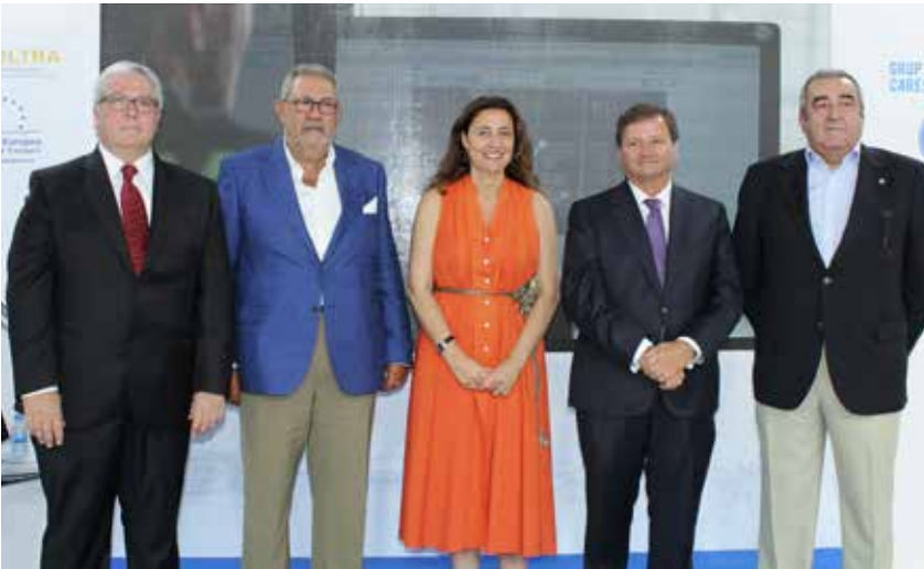
Coctel Comunidad Logística Portuaria de Barcelona